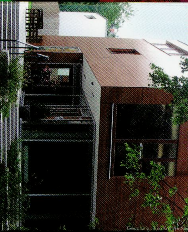
Gestaltung: Büro Kolibri in Nuß

Freiwillig Engagierte besuchen psychisch kranke Bewohner. Ihnen gegenüber können sich Betroffene ganz anders verhalten, handelt es sich doch um Beziehungen, die keinen therapeutischen Anspruch haben und dadurch „Normalität“ vermitteln.